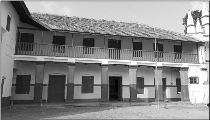
(സെന്റ് മാർഗരറ്റ് യു.പി. സ്കൂൾ)

കുഞ്ഞുമേരിയെപ്പറ്റി കുട്ടുകാർക്ക് നല്ലതുമാത്രമേ പറയാനുള്ളായിരുന്നുള്ളൂ. എല്ലാ വിഷയങ്ങളും പഠിക്കുവാൻ ഉത്സാഹിച്ചിരുന്നുവെങ്കിലും കണക്കു വിഷയത്തോടു കൂടുതൽ താല്പര്യം പ്രകടിപ്പിച്ചിരുന്നതായി കൂടെ പഠിച്ചവർ പറഞ്ഞിരുന്നു. ഗൃഹപാഠങ്ങൾ ചെയ്യുന്നതിലും തനിക്കറിയാവുന്ന കാര്യങ്ങൾ കുട്ടുകാർക്ക്