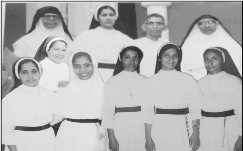
(സ്റ്റെല്ലാമ്മയുടെ കുടുംബത്തിലെ സമർപ്പിതർ

ഇങ്ങനെ സമർപ്പിതരുടെ സഹവാസത്തിൽ വളർന്നു വരുവാനും ഒരു സമർപ്പിതജീവിതം തെരഞ്ഞെടുക്കുവാനും ആ ജീവിതത്തിൽ നീണ്ട വർഷങ്ങൾ സഹനത്തിന്റെ പാതയിലൂടെ ചരിക്കുവാനും സാധിച്ച ഈ ബലിപുഷ്പത്തിന്റെ ജീവിതം വിശുദ്ധിയുടെ പരിമളത്താൽ പ്രശോഭിക്കുന്നതിൽ പരിശുദ്ധാരുപി നിർലോഭം സഹായിച്ചു എന്ന സത്യം നമുക്ക് വിശ്വസിക്കാം.